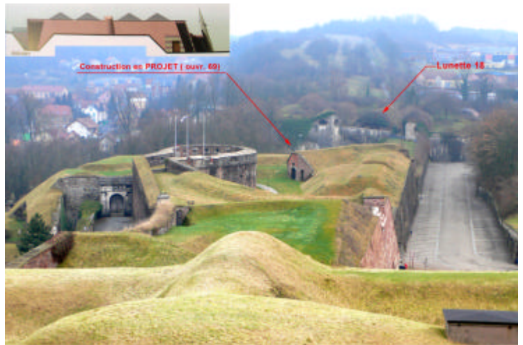
Vue du château montrant la Tour des Bourgeois, l'ouvrage 69 lieu de la construction, puis la lunette 18

Président : Christophe GRUDLER Port. 06.81.02.02.78 Secrétariat : Mireille TOTH Port : 06.60.29.78.11