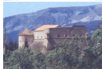
Fort de Savoie